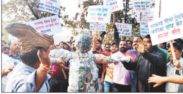
पुतला दहन कर विरोध करते ट्रेलर मालिक।

एसईसीएल की खदानों में अवैध वसूली पर रोक और मूलभूत सुविधाओं की मांग को लेकर जिला ट्रेलर मालिक कल्याण संघ ने सोमवार को प्रबंधन के खिलाफ प्रदर्शन किया। वहीं इस दौरान नाराजगी व्यक्त करते हुए उन्होंने प्रबंधन का पुतला दहन कर अपना विरोध प्रकट किया। जिले में हर दिन भारी वाहनों की तेज रफार व जरूर सड़क की वजह से दुर्घटनाएं हो रही हैं। जिसमें कई लोग चोटिल होने के साथ ही कईयों को जान से भी हाथ धोना पड़ रहा है। इसी कड़ी में सोमवार को जिला ट्रेलर मालिक कल्याण संघ ने शहर में बाईक रैली निकालकर एसईसीएल प्रबंधन कार्यालय के मुख्य द्वार पर नारेबाजी करते हुए पहुंचे और प्रदर्शन किया। इस दौरान उन्होंने प्रबंधन का पुतला भी दहन कर अपना