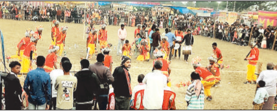
मड़ई मेले में कार्यक्रम प्रस्तुत करते लोक कलाकार।