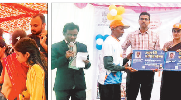
हितग्राहियों को क्रेडिट कार्ड का वितरण करते अतिथि।

भारत संकल्प यात्रा शिविर का आयोजन हो चुका है। शिविर में विभागीय अधिकारियों द्वारा प्रधानमंत्री गरीब कल्याण योजना, प्रधानमंत्री उज्वला योजना, प्रधानमंत्री किसान सम्माननिधि, किसान क्रेडिट कार्ड,