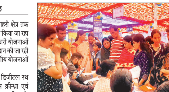
शिविर में सरकार की योजनाओं की जानकारी देते प्रभारी।

जिले के दुस्त्य ग्रामीण अंचल से लेकर शहरी क्षेत्र तक विकसित भारत संकल्प यात्रा का आयोजन किया जा रहा है। जिसमें भारत सरकार की जनकल्याणकारी योजनाओं की जानकारी डिजिटल रथ के माध्यम से प्रदान की जा रही है। इसके साथ ही लोगों को मौके पर विभागीय योजनाओं से लाभान्वित भी किया जा रहा है।